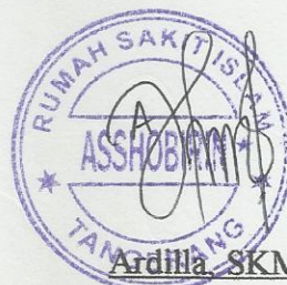
Ardilla SKM Pembimbing Lapangan